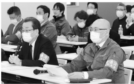
腕章着用で交渉に臨む