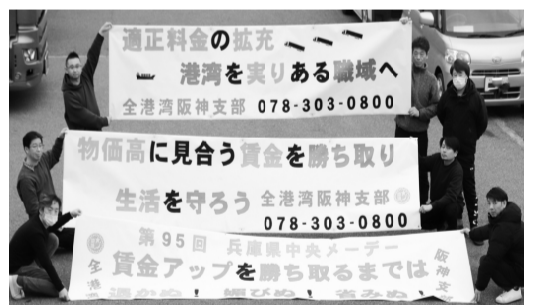
1日で3枚の横断幕を作成

作成は下地塗り2名、本作成はブロック6名の参加があり、執行部の方にも手伝っていただきました。作業では漢字間違いや文言抜け等のハプニングもありましたが、そこをうまくリカバーしたり、デザインに活かしたりしつつ、3枚の横断幕を1日で完成させることが出来ました。また、今年には新たな試みとして、余白にプリンターで印刷できるステッカーシールを使用しトラックとコンテナ船のシールエットを入れ、組合員の仕事をわかりやすく表現したり、全港湾のマークも入れることが出来ました。来年以降も活用していきたいと思えます。横断幕はNCY分会、大