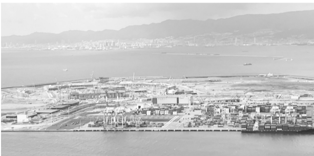
展望台から見た夢洲

状がある」とし、更に「休みはあるが仕事があれば出勤しなければならぬ。残業しなければ給料が少ない。現実には厳しいものがあるが、オヤジのおる会社に入りたいと息子に言われる会社にしていかなければならぬ」と話された内容は印象深く、とても勉強になりました。学習会では大阪IRについて4つのテーマで学習しました。IRについては築港支部。経済面における問題についてには阪神支部。インフラ整備問題については大阪支部。治安への影響については神戸支部。各支部がそれぞれ考え、資料などを