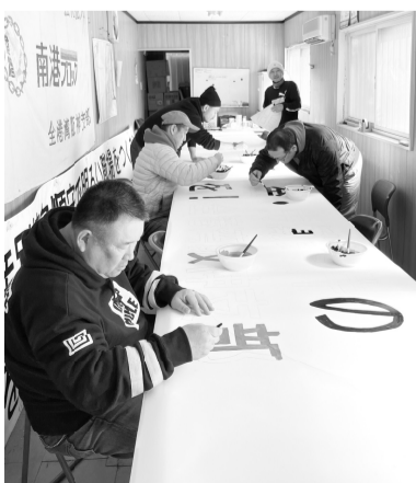
真剣に手作業で作成