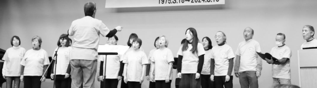
テーマ曲「波よひろがれ」を大合唱

※「核のタブー」とは、77年前、米国が広島、長崎に原爆を投下して以来、「タブー視されてきた核使用の可能性」