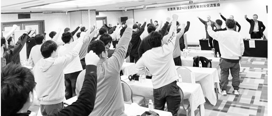
全港湾青年部、未来へ団結ガンバロー

集め、勉強してきたことを発表しました。分散会後の感想では「とても分かりやすく、パワーポイントを活用し、数字や実際に撮影された動画などが非常に分かりやすい」との声が非常に多く挙がりました。ニュースなどは都合の良い部分しか放送しておらず、今大阪が抱えている問題が明確に伝えられた非常に良い学習会と分散会になりました。夜には親睦交流会が行われ、皆さん緊張気味でしたが、時間が経つにつれ緊張の糸もほぐれ、良い時間を過ごすことができました。